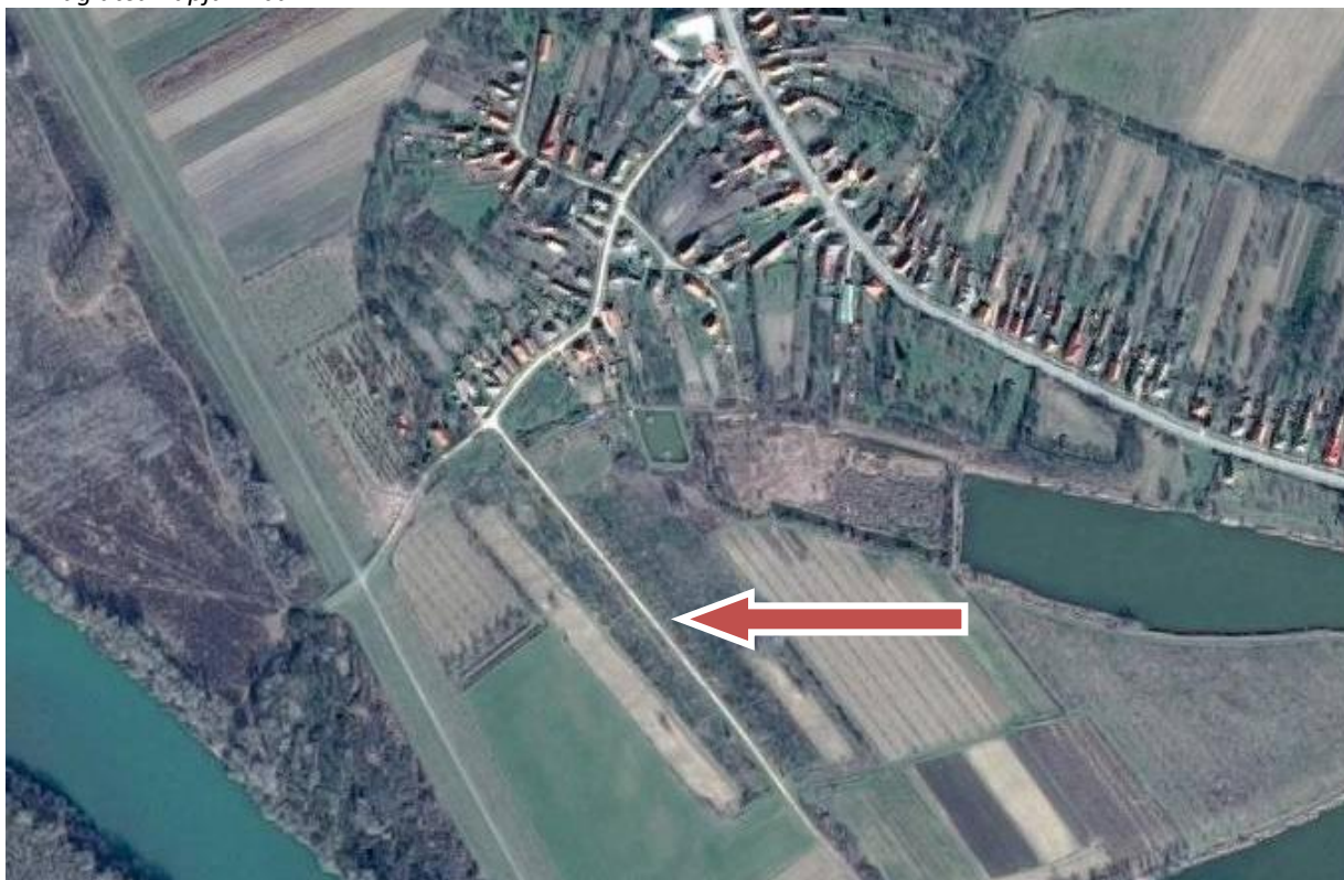
A Virág utca napjainkban