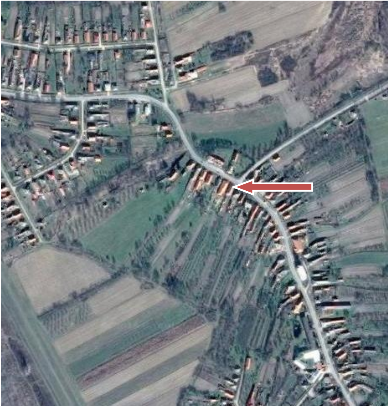
A Rákóczi utca nyugati oldala