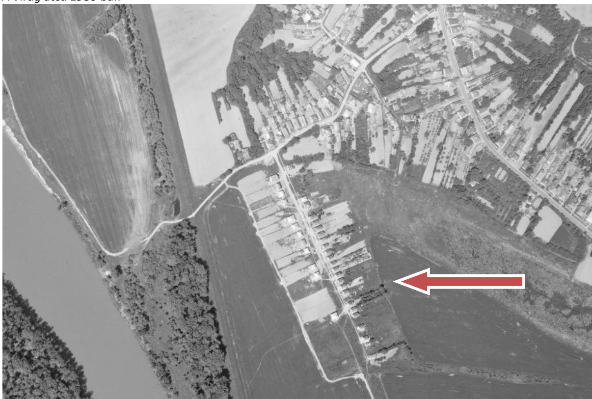
A Virág utca 1986-ban

A község belterületének dél-délnyugati oldalán, a Virág utca két oldalán elhelyezkedő telektömbök. Az utca két oldalán közművesített, 60-70 építési telek helyezkedik el. A jelenlegi övezeti besorolása különleges beépítésre szánt szabadidő központ területe. A terület körül – már külterületen – hétvégi házas üdülőterületek sorakoznak, a Tisza-folyó védműve és a belterület között.